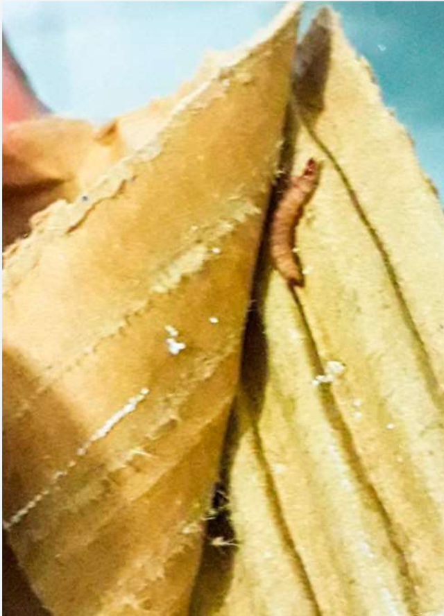
Quando na fase larval o Necrobia , apresenta coloração bege e o seu comprimento varia de 1mm a 10mm, dependendo do seu estágio de desenvolvimento.

O Necrobia possui metamorfose completa: ovo, larva, pupa e inseto adulto. O ambiente perfeito para seu desenvolvimento é de aproximadamente 30° C e umidade relativa de 70%. Os insetos adultos podem sobreviver por até 14 meses dependendo da condição do ambiente e são atraídos por gordura animal e alimentos com alto teor de proteína. Por esse motivo, são encontrados em alimentos como carne de animais como peixe, suínos e frango, ossos defumados e até mesmo no couro (usado como “brinquedo”). Por essa razão, pet food é um grande atrativo para esse tipo de inseto.